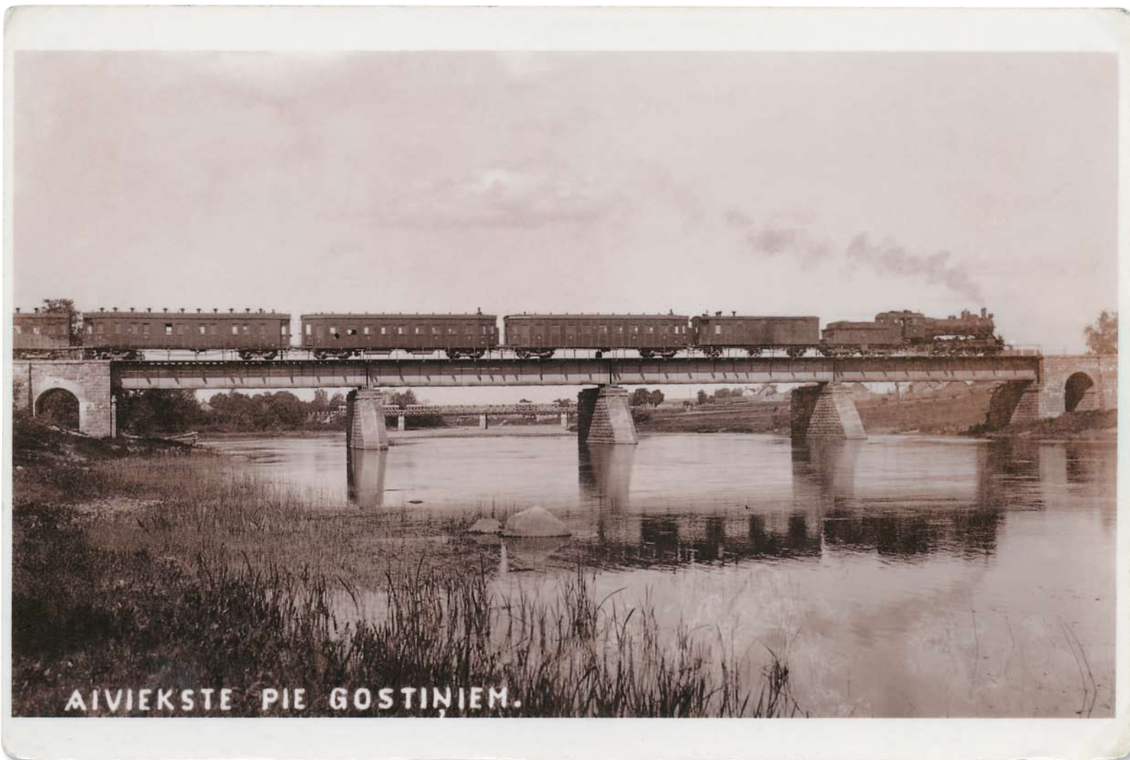
AIVIEKSTE PIE GOSTIŅIEM.