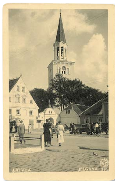
Par to, ka Jelgava ir viena no Latvijas pilsētām, kas pamatīgi cieta kara laikā, var pārliecināties arī šajā fotogrāfijā.